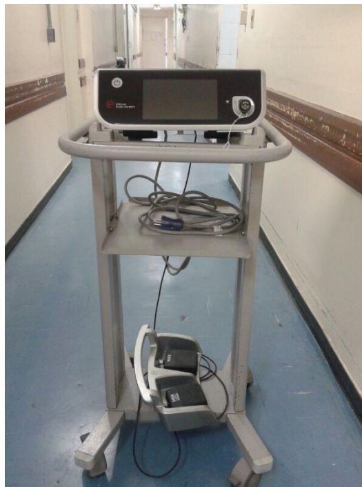
Fig. 02 – Bisturi Ultrassônico