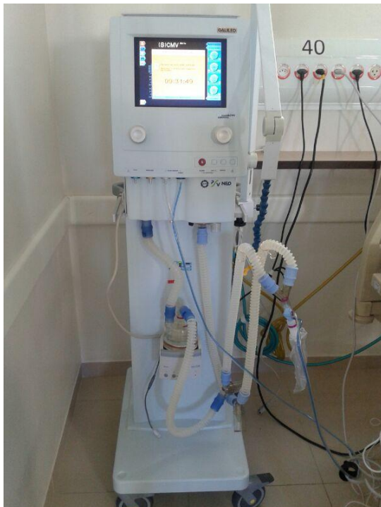
Fig. 05 – Ventilador Pulmonar