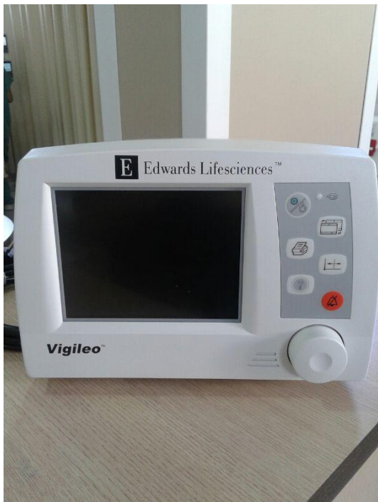
Fig. 01 – Monitor de Debito Cardíaco Contínuo.

Em 2013, os valores de investimento em equipamentos clínicos na Santa Casa de Marília, provenientes de recursos federais, parcerias e recursos próprios totalizaram em R$ 1.450.867,50 . Seguem abaixo imagens de alguns dos equipamentos adquiridos e listagem completa de investimento: