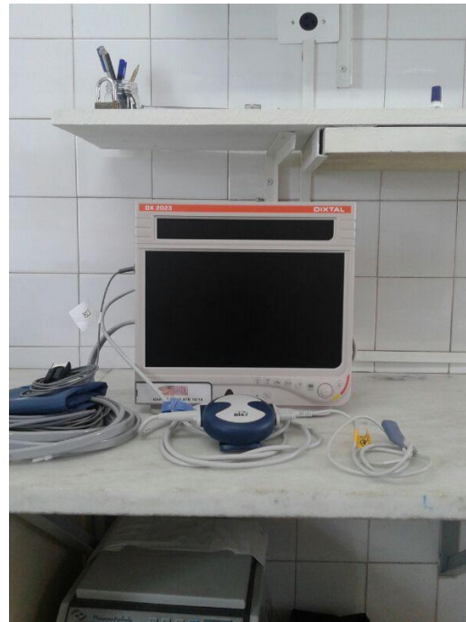
Fig. 04 – Monitor Cardíaco com Modulo Bis