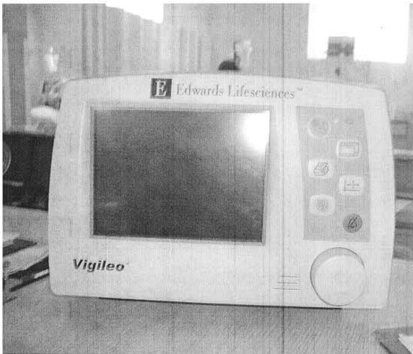
Monitor de Débito Cardíaco- CV: 773654/2013